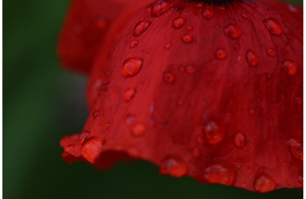
Klaproos met regendruppels

Wanneer planten? De beste tijd om knoflook te planten is vanaf september tot half november of voor de eerste nachtvorst. Rond deze tijd heb je vast wel wat ruimte in de tuin. Veel groentes zijn al geoogst en er is niet heel veel meer wat je kan zaaien en planten.