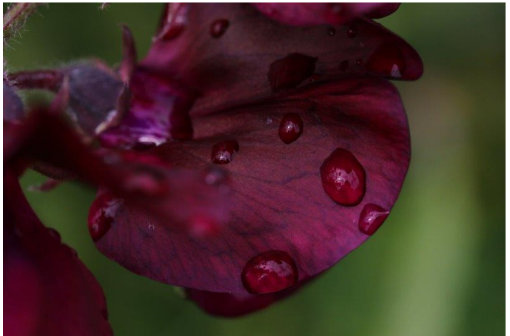
Lathyrus in juni op een tuin

Alle losliggende spullen die in de winter overlast kunnen veroorzaken (bij storm en dergelijke) dienen te worden verwijderd of vastgelegd. Bovendien vragen wij u de komende weken extra te letten op het onderhoud van het middenpad.