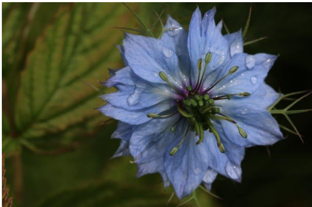
Juffertje in 't groen (Nigella) - een echte bijenplant

Bedek vorstgevoelige groenten zoals (knol)selderij, sla en prei wanneer het vriest met een laagje stro of vliesdoek. Spruitjes hoeft je niet te voorzien van vorstbescherming, deze groenten zijn zelfs het lekkerst na een nachtje vorst.